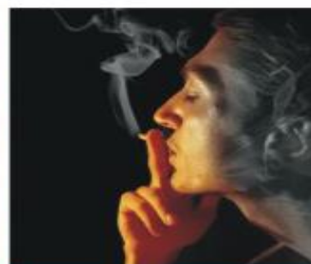
Курение и Алкоголь