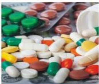
Побочные эффекты лекарств